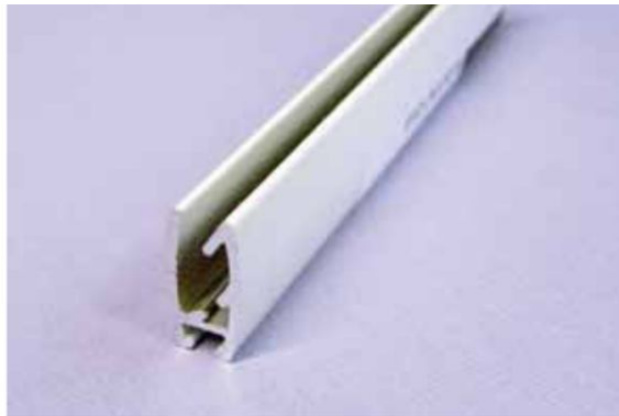
Obciążnik aluminiowy (na zamówienie klienta)