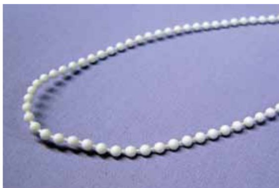
ISSO - 3,0 lub 3,2 mm x 6 mm Do mechanizmu MINI-T 3 (na zamówienie klienta)