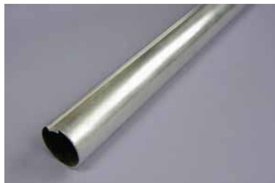
Rura aluminiowa o średnicy zewn. Ø32 (standard)