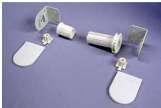
Mechanizm 25 mm niski

Do produkcji rolet standardowo wykorzystywany jest mechanizm w kolorze białym. Występuje on w dwóch wersjach: