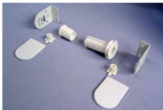
Mechanizm 25 mm wysoki

Mechanizm wysoki przeznaczonych jest do rolet wysokich ze względu na możliwość nawinięcia większej ilości materiału.