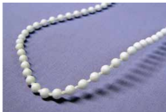
LUX 4,5 x 6 mm (na zamówienie klienta)