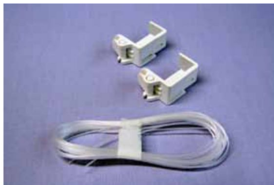
Zaczep dolny żyłki i żyłka