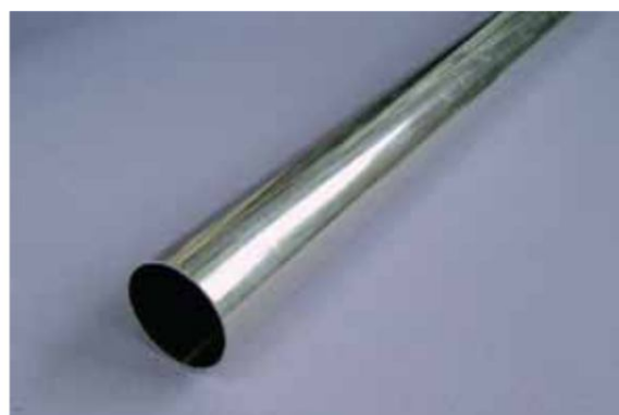
Rura aluminiowa o średnicy zewn. 25 mm (na zamówienie klienta)