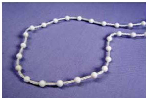
STANDARD 4,5 x 12 mm (standard)

Do wykonania rolet mogą być stosowane dwa rodzaje łańcuszków: