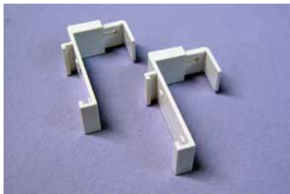
Uchwyt górny bezinwazyjny

W przypadku zastosowania prowadzenia żyłkowego wykorzystywane są uchwyty dolne bezinwazyjne, w których jest zaciskana żyłka. Mocowania są regulowane i można je dostosować do różnej szerokości okien. Zaczepy żyłki są wykonane w kolorze białym lub są przezroczyste.