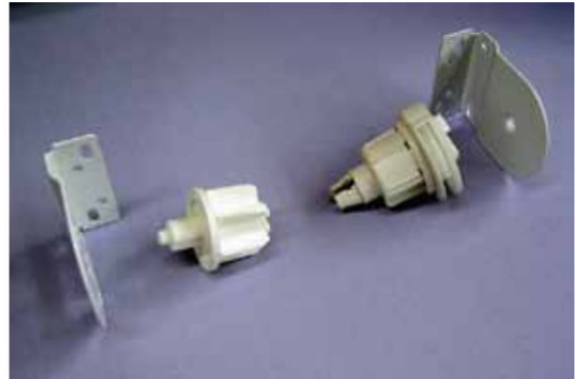
Mechanizm 32 mm metal