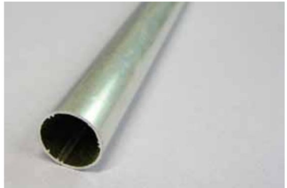
Rura aluminiowa o średnicy zewn 19 mm (na zamówienie klienta)