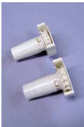
Kółko napędowe Mini-T 3 (u góry) Kółko napędowe Mini-T 4,5 (u dołu)

Mechanizm MINI-T występuje w 2 wariantach.