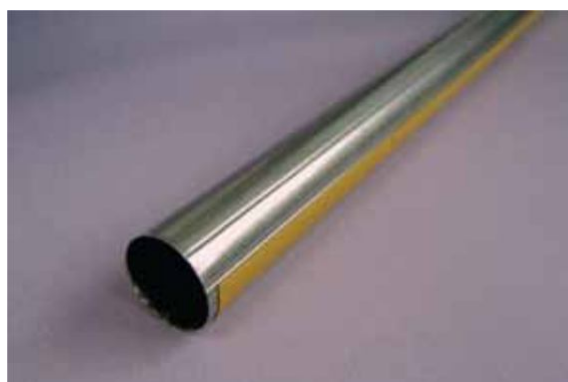
Rura stalowa o średnicy zewn. 25 mm (standard)

Stosowane są dwa rodzaje rury nawojowej do rolet: