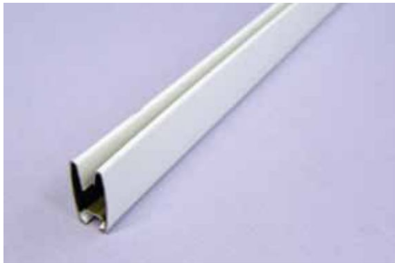
Obciążnik stalowy (standard)

W roletach Expert stosowane są dwa rodzaje obciążnika tkaniny: