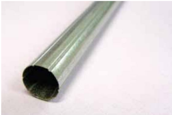
Rura stalowa o średnicy zewn 17 mm (standard)

Stosowane są dwa rodzaje rury nawojowej do rolet: